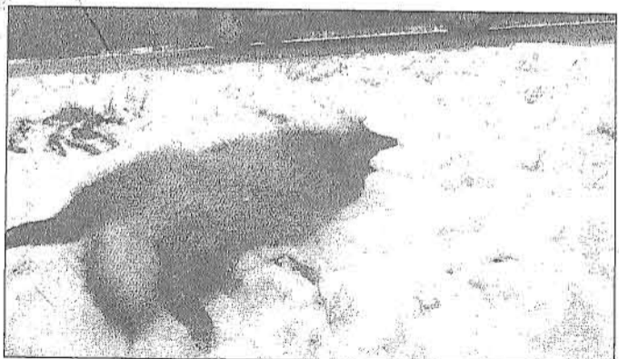
Huono karma. Supikoira poikueista arviolta vain joka kymmenes jää henkiin. Kantaa verottaa esimerkiksi liikenne.