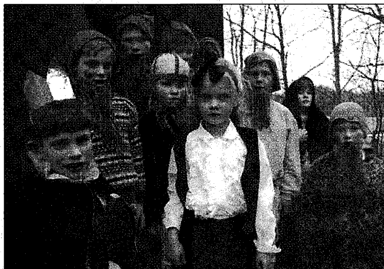
Prinssi, Lumikki ja kääpiöt pistäytyivät Suomiehen koulussa lauantaina. He käyvät koulussa säännöllisesti viikollakin, mutta ovat silloin ihan tavallisten pienten oppilaiden näköisiä.