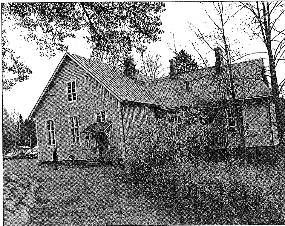
Suomiehen koulu vihittiin käyttöön 5.11.1916. Kunnan rakentaman koulun valmistuminen viivästy ihiukan ja koulunkäynti jouduttiin aloittamaan lähellä olleessa torpassa.